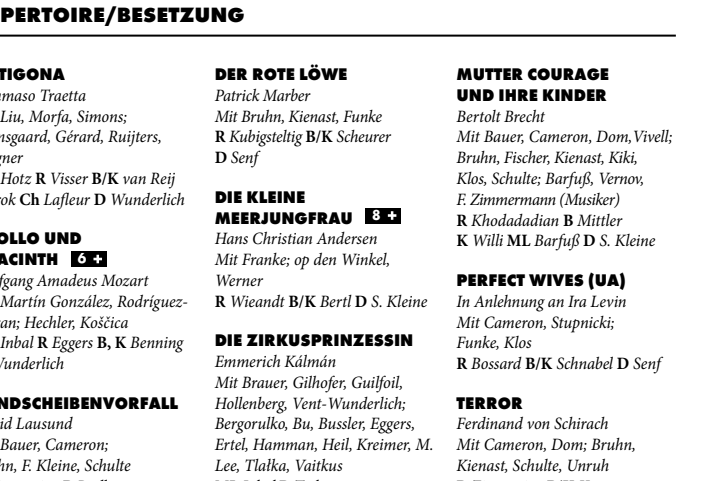
Die Zirkusprinzessin Genadjus Bergorulko

UNTER EINEM HIMMEL (UA) Mauro de Candia Mit Comisso, Kamei, Naku, Sanchez Eglise, Wijsman; Caspi, Del Canto, Hysentroyt, Khudimov, Minervini C/B/K de Candia D Stöckemann