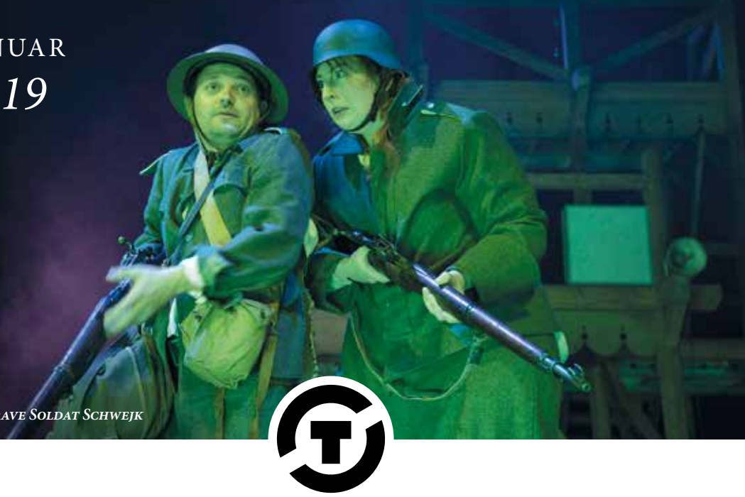
DER BRAVE SOLDAT SCHWEJK