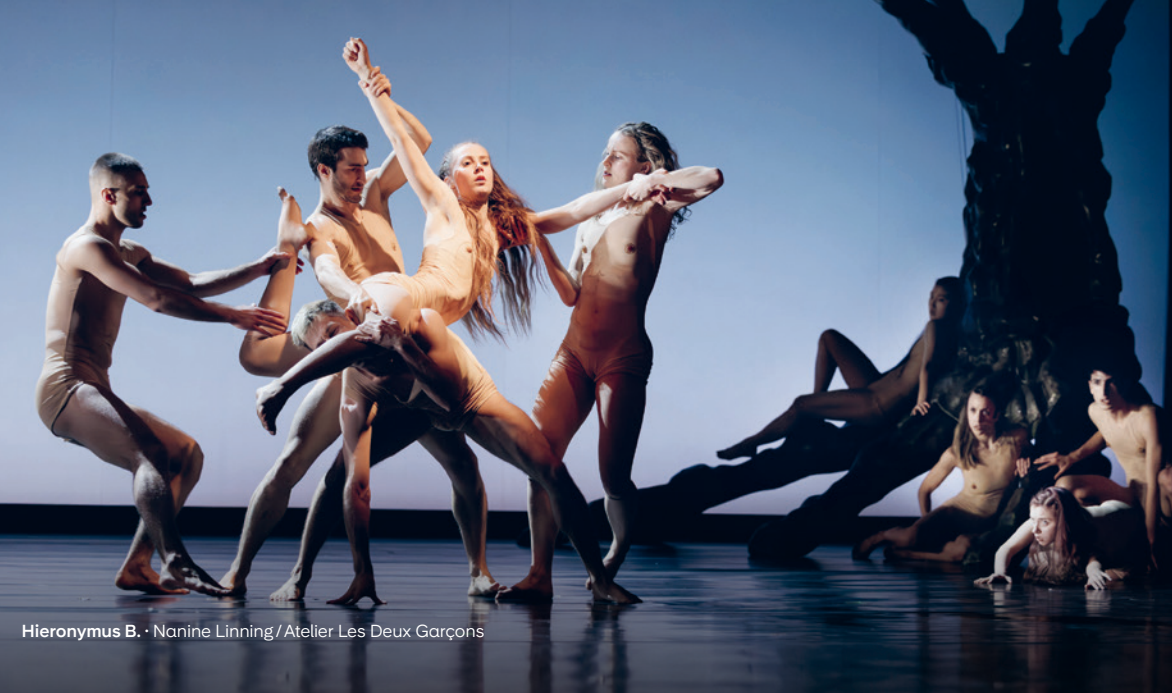
Hieronymus B. · Nanine Linning / Atelier Les Deux Garçons