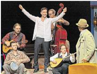
„Istanbul“ wieder am 25.08. und 08., 21. und 22.09.2024.

Unter theater-osnabrueck.de oder an der Theaterkasse.